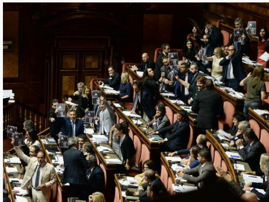
Il decreto Milleproroghe discusso al Senato

L'idea di un altro testo con libertà alle Regioni. L'appello delle mamme contrarie per raccogliere 75 mila firme. Tra gli altri interventi, l'ok al bonus cultura per i diciottenni fino a tutto il 2018