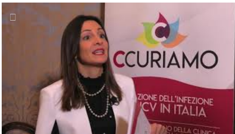
CCuriamo, una fotografia della realtà italiana e delle strategie di eradicazione dell'epatite C