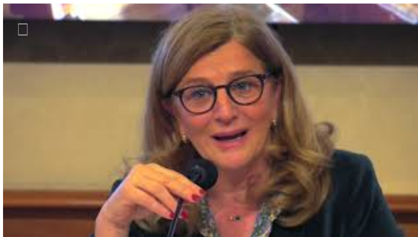
Epatite C screening ora gratuiti. Equivalenza terapeutica pone a rischio il fondo innovativi