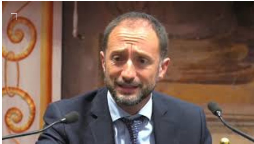
Epatite C, cosa è stato fatto in Italia e cosa resta ancora da fare?