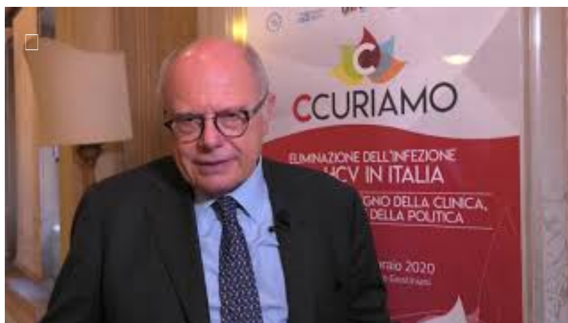
Epatite C, cosa resta ancora da fare in Italia per arrivare all'eradicazione?