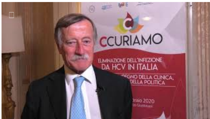
Epatite C: le strategie per far emergere il sommerso