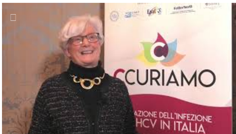
Le 3 parole chiave per eradicare l'epatite C: farmaci, sommerso e Piano nazionale