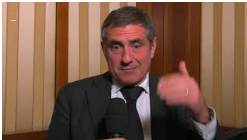
Epatite C, costo dei farmaci oggi sostenibile. Valutare aspetti clinici per equivalenza terapeutica