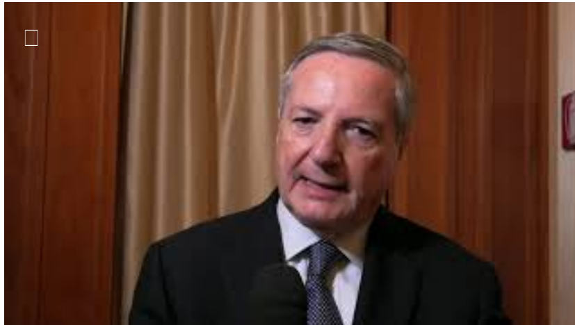
Epatite C, farmacologi chiedono un confronto sui criteri Aifa su equivalenza terapeutica dei farmaci