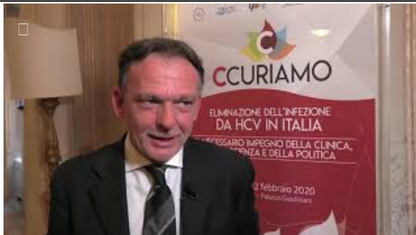
Epatite C in Italia, cosa resta ancora da fare?