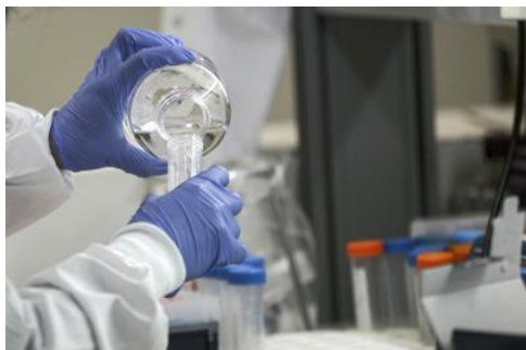
Coronavirus, in Italia ok veloce a farmaci promettenti: ecco possibili cure

Via libera immediato in Italia a tutte le possibili terapie promettenti contro il nuovo coronavirus.