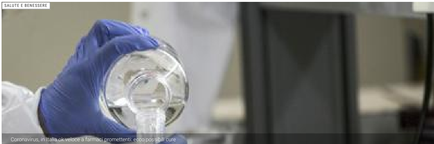
Coronavirus, in Italia ok veloce a farmaci promettenti: ecco possibili cure